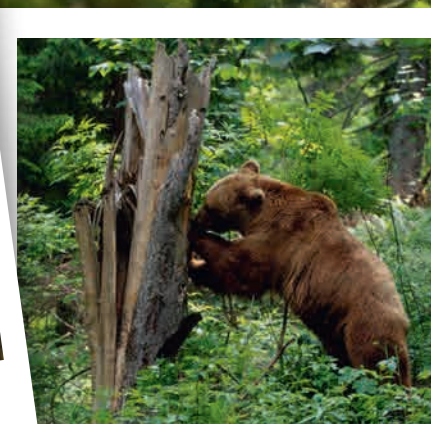
Een bruine beer zoekt naar lekkers in een boom.